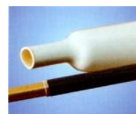
3:1 Dual Wall