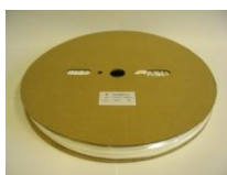
2:1 Bulk Roll

3:1 bužírky s lepidlem se dodávají pouze v černé barvě a dodávají se v délce 1,2 metru.