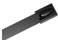
STALOWE OPASKI ZACISKOWE POWLEKANE