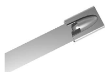
STALOWE OPASKI ZACISKOWE